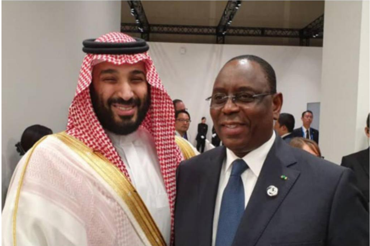
LE PRÉSIDENT SALL AVEC LE PRINCE HÉRITIER D'ARABIE SAOUDITE MOHAMMAD BIN SALMAN