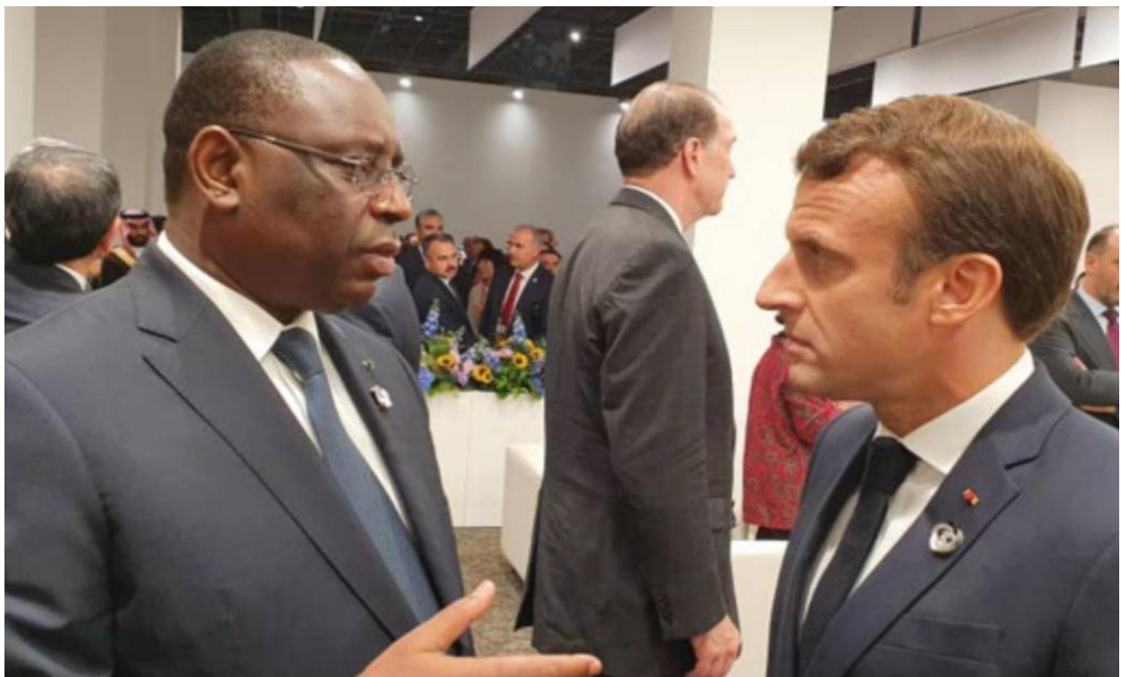
LE PRÉSIDENT SALL EN ECHANGE AVEC SON HOMOLOGUE FRANÇAIS MONSIEUR EMANNUEL MACRON