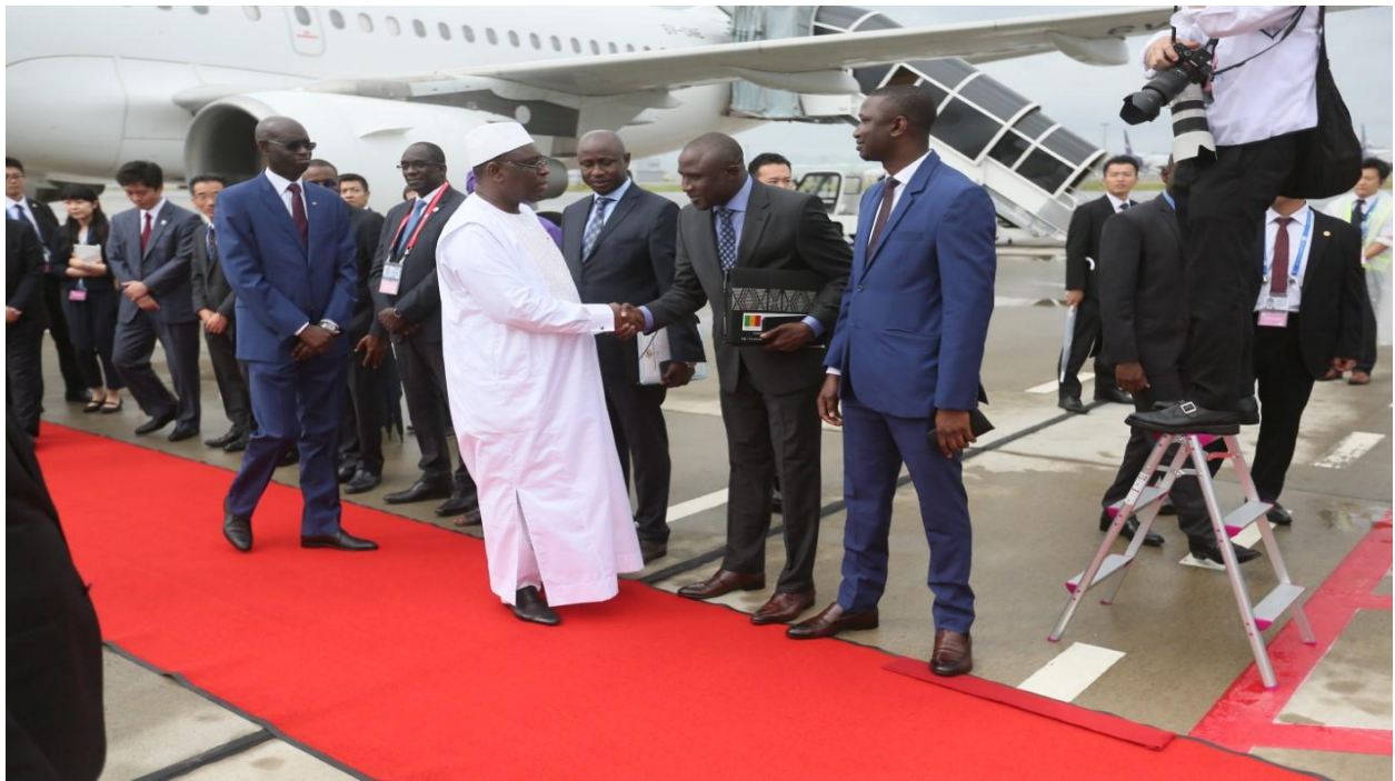
LE PRÉSIDENT SALL, ET L'AMBASSADEUR CISS, AVEC LA DÉLÉGATION SÉNÉGALAISE