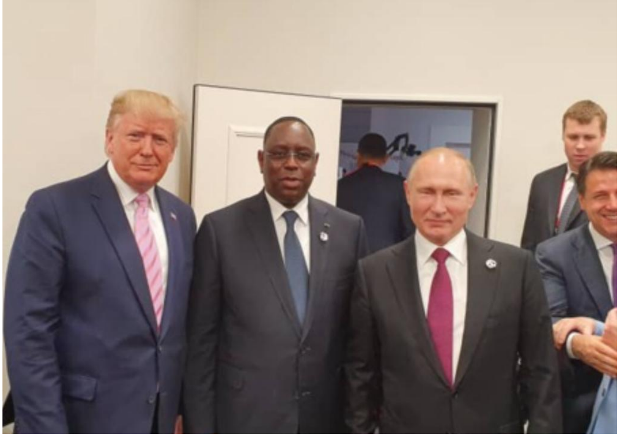
LE PRÉSIDENT SALL AVEC SES HOMOLOGUES AMÉRICAIN MONSIEUR DONALD TRUMP, ET RUSSE MONSIEUR VLADIMIR POUTINE

Le Sommet du G20 à Osaka a été une occasion propice pour le Président SALL d'échanger, pendant deux (02) jours, dans une atmosphère de franche cordialité, avec les principaux dirigeants du monde et avec les responsables de grandes institutions internationales.